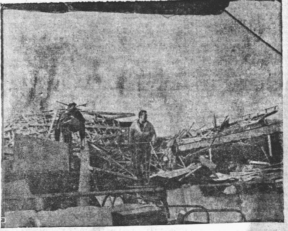
EL TORNADO en Crystal Lake, Illinois, un suburbio de Chicago, dejó a su paso este montón de escombros de los que en un tiempo fue una tienda por departamentos. Unas 120 casas fueron también destruidas.

CAPRICORNIO 22 de Diciembre al 20 de Enero