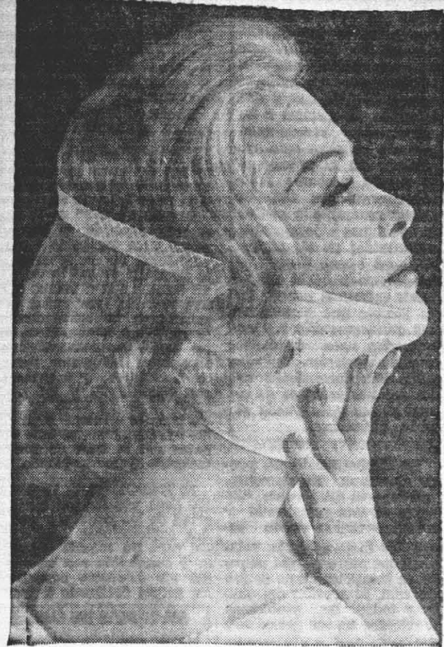
Un vendaje especial ayuda a dar firmeza a los músculos del cuello y a evitar la doble barbilla.