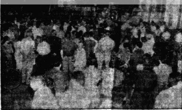
NUMEROSO público rodeó las tribunas de las tres mayores agrupaciones políticas que participarán mañana de las elecciones municipales de Posadas, y que cerraron sus respectivas campañas en horas de la víspera. El peronismo (grabado de la izquierda) fue el que contó con mayor concurrencia; mientras la UCRP (grabado del centro), y el Frente Comunal (derecha) equilibraron el volumen de sus respectivos públicos. Al término de los actos, dirigentes peronistas denunciaron un hecho que podría tener graves consecuencias, del cual se hace referencia en la presente crónica.

La elección de mañana debe ser aprovechada por los electores de la ciudad para salvar de ella lo que todavía puede salvarse traducido en bien público y, en una palabra, recuperar el tiempo perdido. Para ello, debe elegirse al mejor, sea del sector político que fuere.