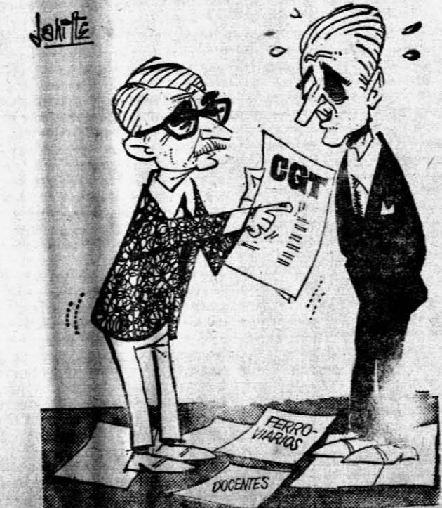
SOLA — Si no evitamos el nuevo paro de la CGT nadie negará que todos los argentinos "ESTAMOS PARADOS".

Añade que "la propuesta de radicación de capitales de Industrias Kaiser de Chile Ltda. no aspira a aumentar hasta románticas proporciones utópicas el porcentaje requerido de partes chilenas en los vehículos a producir, sino que ha sido preparada sobre la experiencia argentina en la materia, donde la industria nacional de automóviles es una realidad palpable desde muy poco tiempo después de la instalación de IKA". Por último dice que "la creación de Industrias Kaiser de Chile Ltda. es, por otra parte, un símbolo de la confianza que las empresas mencionadas tienen depositada en el futuro de la República de Chile y de los países signatarios del tratado de la Asociación Latinoamericana de Libre Comercio".