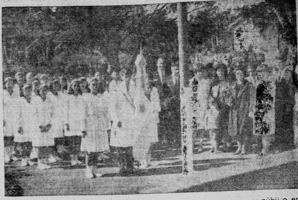
ACTO.— Con motivo de los festejos del 25 de Mayo, los escolares y público en general de la localidad de San Pedro, rindieron homenaje a los próceres de Mayo