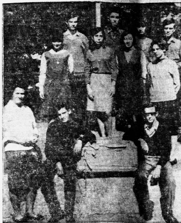
DONACIONES - Miembros del Interact Club de esta ciudad con directivos del Hogar de Niñas Santa Teresita...