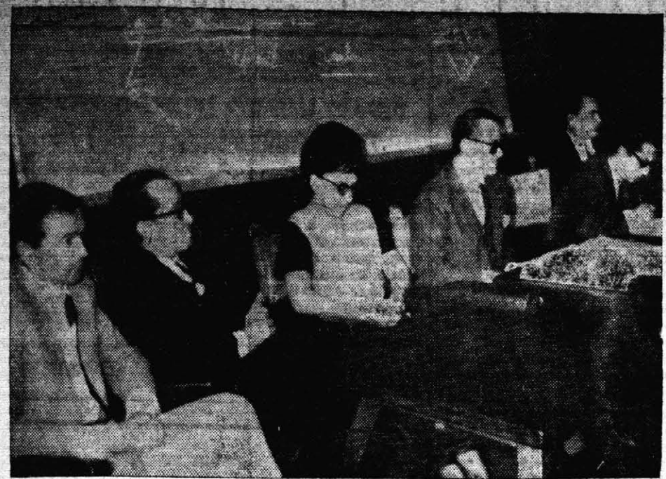
MESA DIRECTIVA SALIENTE. En el presente grabado aparecen los integrantes de la comisión directiva saliente del Colegio de Abogados de la Provincia. Durante el curso de la asamblea se procedió a la elección de una nueva comisión, y se votó una declaración vinculada a la situación en la que se encuentran los jueces provinciales, a quienes se les habría solicitado la presentación de sus respectivas renunciaciones, según se dijo.