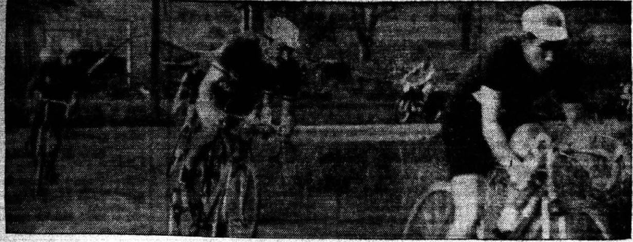
Próxima la llegada a Corpus donde se congregó bastante público al arribo de los ciclistas...