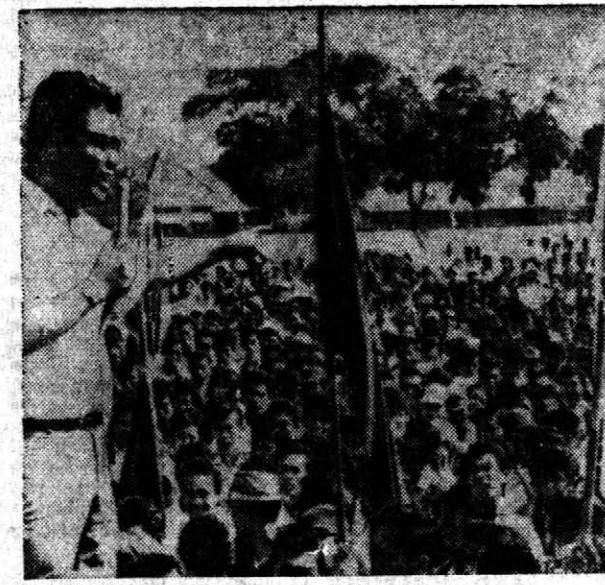
CONTRA SUKARNO — Un dirigente estudiantil indonesio exhorta a una multitud de compañeros estudiantiles en la Plaza Panchasila de Jakarta durante una manifestación en contra del presidente Sukarno. (Cablefoto).

El presidente parece decidido a mantenerse al margen de las demandas estudiantiles hasta que termine esa reunión y la visita oficial de Kohman a Indonesia. Entre tanto, la atmósfera política sigue en tensión, mientras los indonesios esperan la próxima medida de los estudiantes que hace apenas tres días avanzaron sobre cuatro compañías de tropas y tanques para exigir al Parlamento las excusas o la expulsión de Sukarno.