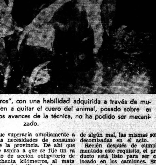
UN OFICIO — Los "matambros", con una habilidad adquirida a través de muchos años de práctica, proceden a quitar el cuero del animal, posado sobre el catre. Ese oficio, a pesar de los avances de la técnica, no ha podido ser mecanizado.

Después de un lapso de tres a cinco horas, ponga a disposición de los matarifes, abastecedores, carniceros, toda la carne vacuna que debe consumirse una población de algo más de cien mil habitantes.