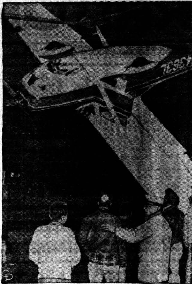
UN MAL ATERRIJAJE.— El piloto Ben Hill, de 27 años de edad, vecino de Redlands, California, fue rescatado por un equipo del departamento de bomberos...