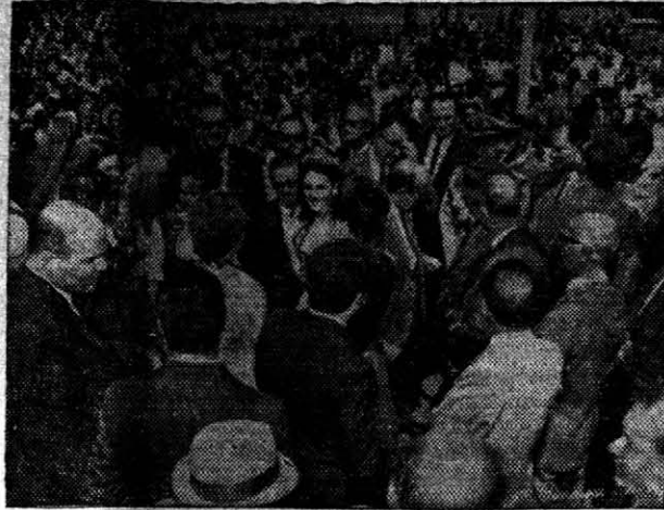
VISTA parcial de las autoridades y la concurrencia que se dio cita en el local de la exposición, para el acto de inauguración de la Primera Fiesta Nacional del Soja, que se está llevando a cabo en la ciudad de Santa Rosa, Brasil.

Analisis Cómprala hoy y todas las semanas