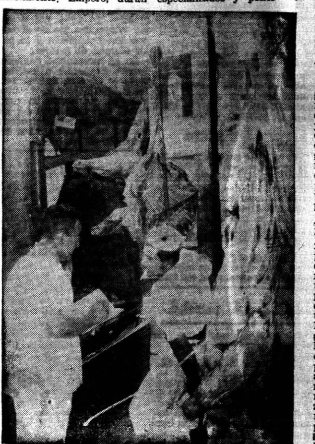
EN LA PLAYA del establecimiento, las medias reses, listas para el consumo, son cargadas en los camiones distribuidores. Se cumple allí la última etapa de un proceso, algunos de cuyos detalles son desconocidos por la población.

La Faena Es de hacer notar, empero, que previo a dicha iniciación, se hace necesario movilizar una gran cantidad de peones especializados y poner en