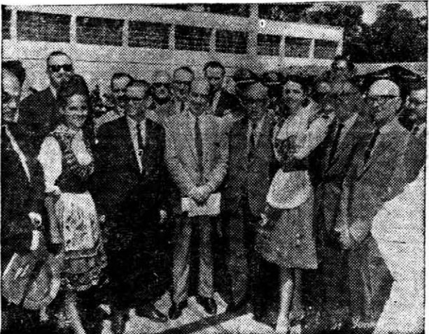
El MINISTRO de Economía de Misiones, junto con el gobernador de Rio Grande del Sur, señor Meneghetti, autoridades argentinas y brasileñas, la reina del soja, Neiva Vaccaro y la princesa Maide. Al fondo el salón de la exposición.