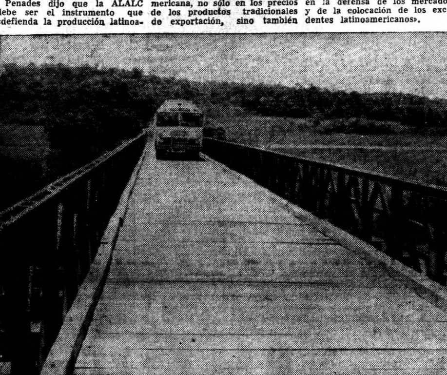
PUENTE BAILEY HABILITADO: El nuevo puente tendido sobre el arroyo Yabebiry, en las cercanías de San Ignacio, fue habilitado ayer al tránsito de vehículos con lo que ha quedado prácticamente normalizado el transporte de cargas y pasajeros por la ruta 12.

res". En sesión solemne, realizada en el Senado de la República, Penades destacó que "la ALALC ha logrado para nuestros productos un mercado más amplio, y marcha hacia la integración económica de la América Latina". Penades dijo que la ALALC mexicana, no sólo en los precios y de la colocación de los excedentes latinoamericanos, sino también en la defensa de los mercados de exportación, sino también