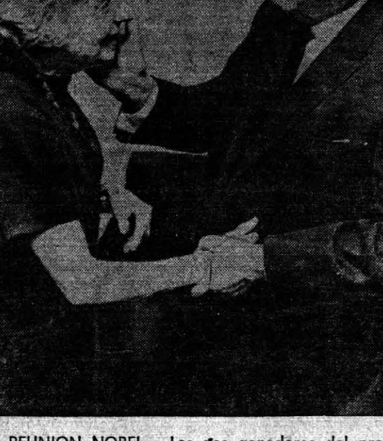
UNA REUNION NOBEL. — Los dos ganadores del premio Nobel de Literatura de este año se reúnen por primera vez en Estocolmo, Suecia, donde recibirán sus premios de manos del rey Gustavo Adolfo. Son ellos: Nelly Sachs, de Suecia, y Joseph Agnon, de Israel.

10º) Que los infundados y calumnias que son inconscientes fines se han desatado contra el suscripto hasta el presente y los que sobrevengan no colaborarán su espíritu y no lograrán hacerle apartar un trecho de la senda que se ha trazado donde permanecerá inmovilizable con