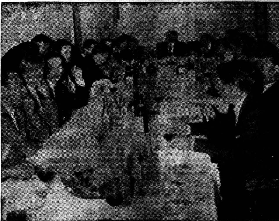
VISTA PARCIAL de la concurrencia a la cena de agasajo a los periodistas ofrecida por el gobernador Montiel, en la Casa de Gobierno.

“Como hasta ahora no se conoce el pensamiento oficial en cuanto al presupuesto nacional para 1967 — que debió ser elevado al presidente de la Nación el 19 de diciembre último, según el punto 3, inciso a), capítulo 3, del “Programa de Ordenamiento y Transformación” contenido en la “Directiva para el Planamiento y Desarrollo de la Acción de Gobierno”— y consecuentemente se ignora cómo ha de financiarse el fisco, todo indica que esta euforia inflacionaria ha de continuar lamentablemente hasta que se diagrama y ejecute otra política económica”.