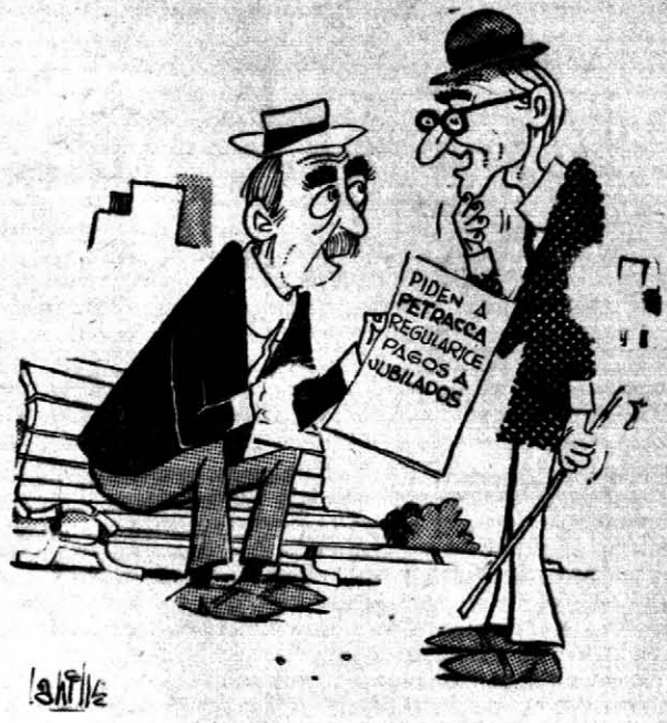
AMONOS Ningún jubilado escapa y como Balá una peca... Pues, Balá piensa en Petasca y nosotros... en PETRACCA

¡Oh! GUAYAQUIL 28 (UPI) — Una turba asaltó el Ayuntamiento, desalojando del mismo al alcalde y a los concejales, en apoyo de una petición de reorganización del Cabildo presentada en el Quito por el líder político Assad Bucaram. Los asaltantes, que primero lanzaron petardos contra el inmueble, penetraron al mismo a los gritos de «Viva Bucaram» y fueron desalojados con bombas lacrimógenas por la policía. En el momento de retirarse, los grupos bucarmanistas dispararon a. r. mas de fuego, hiriendo gravemente a una policía.